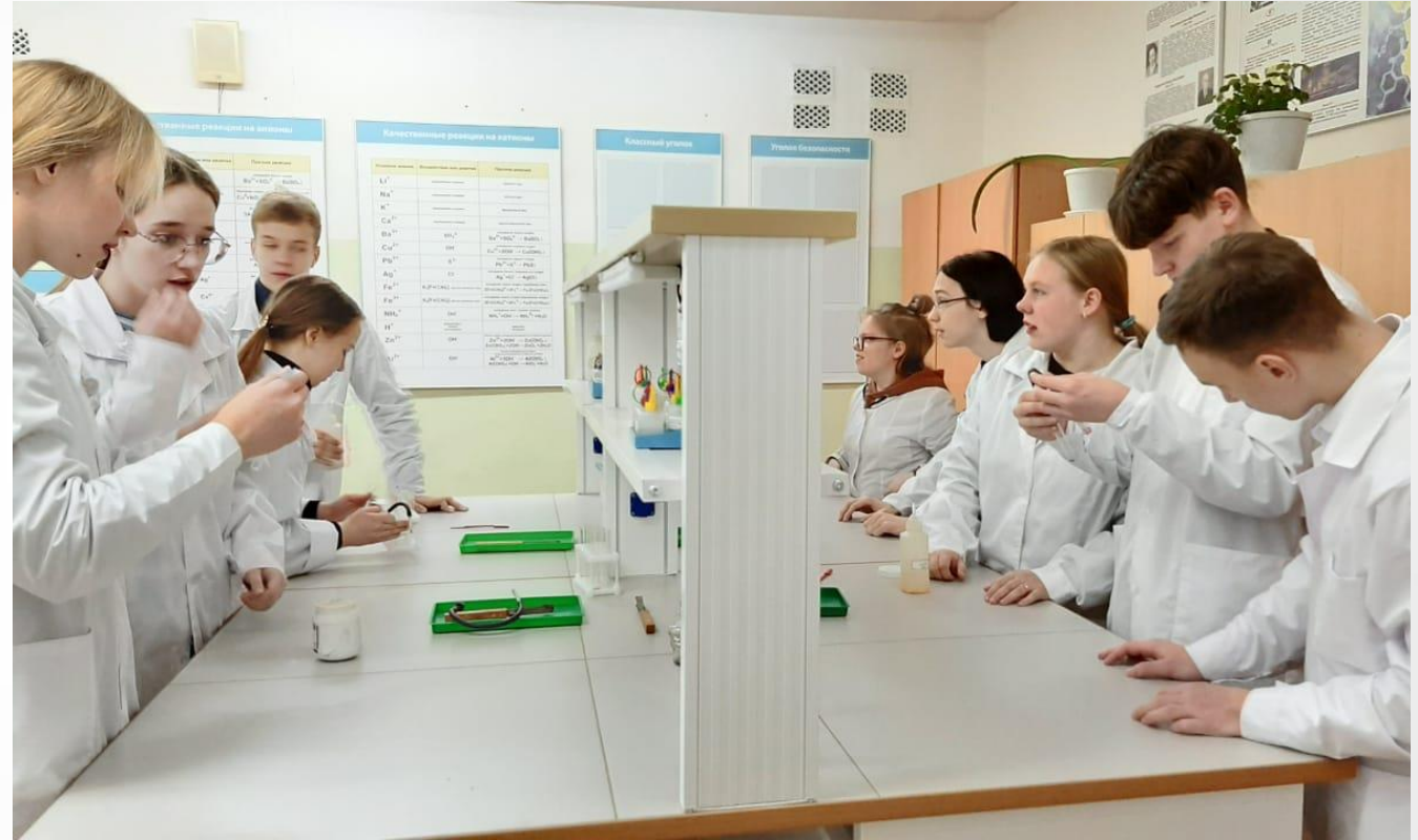
Урок химии (лабораторная работа) в медицинском классе