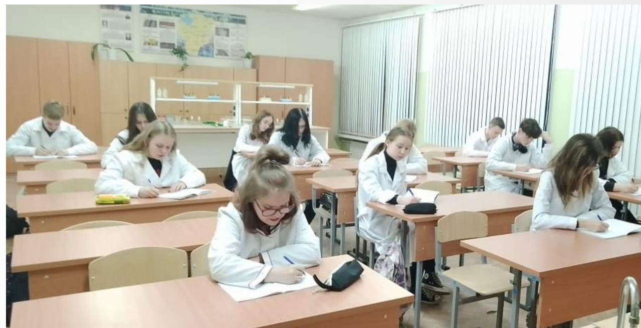
Урок химии в медицинском классе

Урочная деятельность Учебный план на углубленном уровне естественно-научный профиль