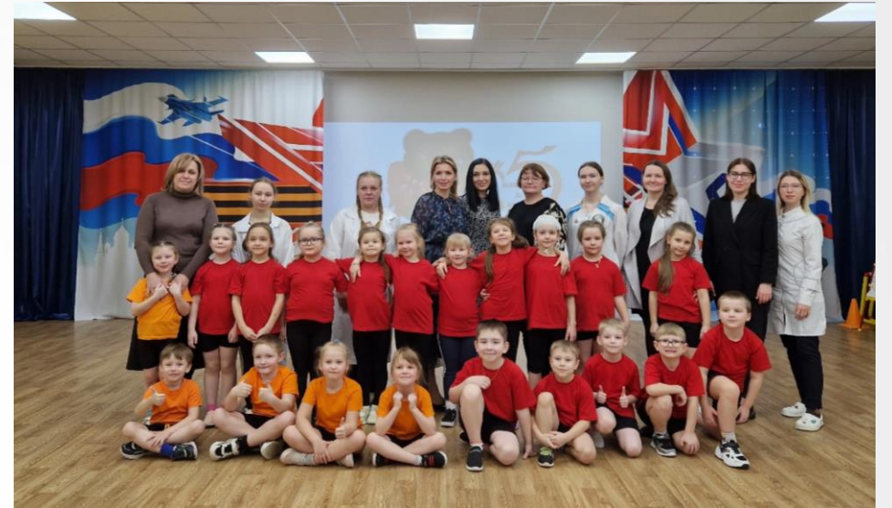
Реализация проекта «Клиника для мишек»