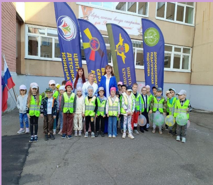
Экскурсия в школу