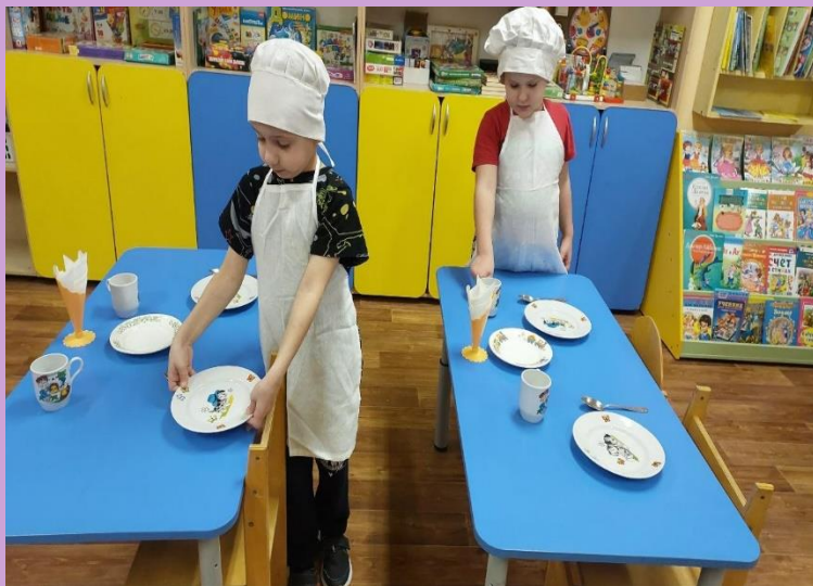
Дежурство по столовой