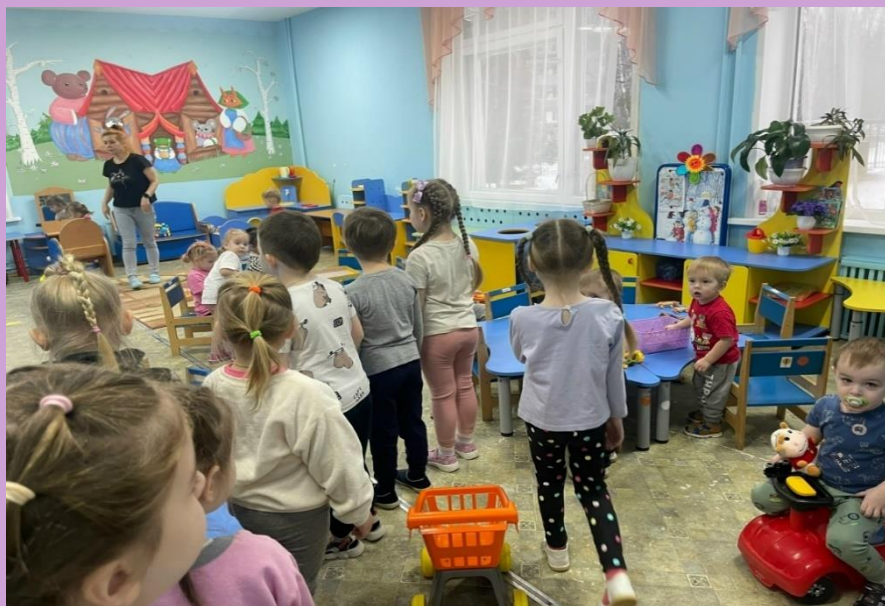
Наблюдение за работой воспитателя