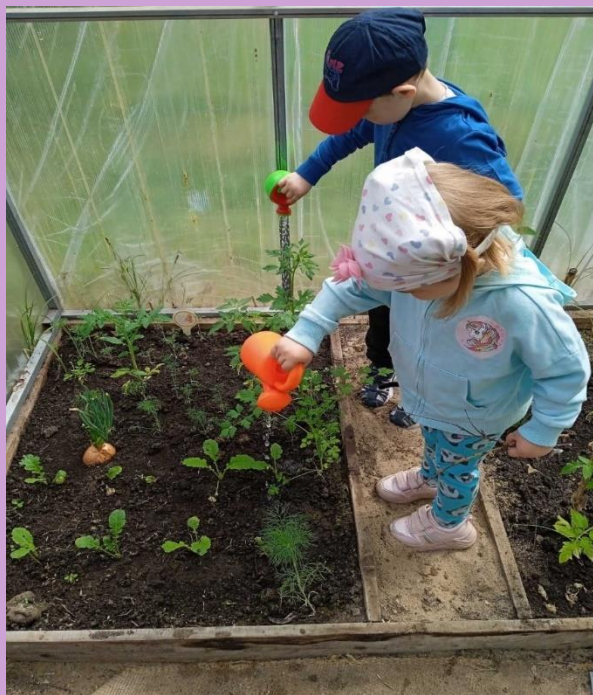
Посадка овощей в теплице