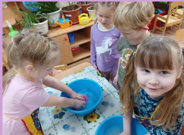
Стирка кукольной одежды