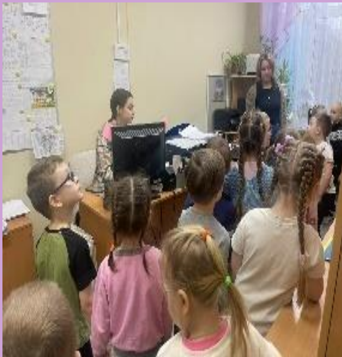
Наблюдение за работой старшего воспитателя