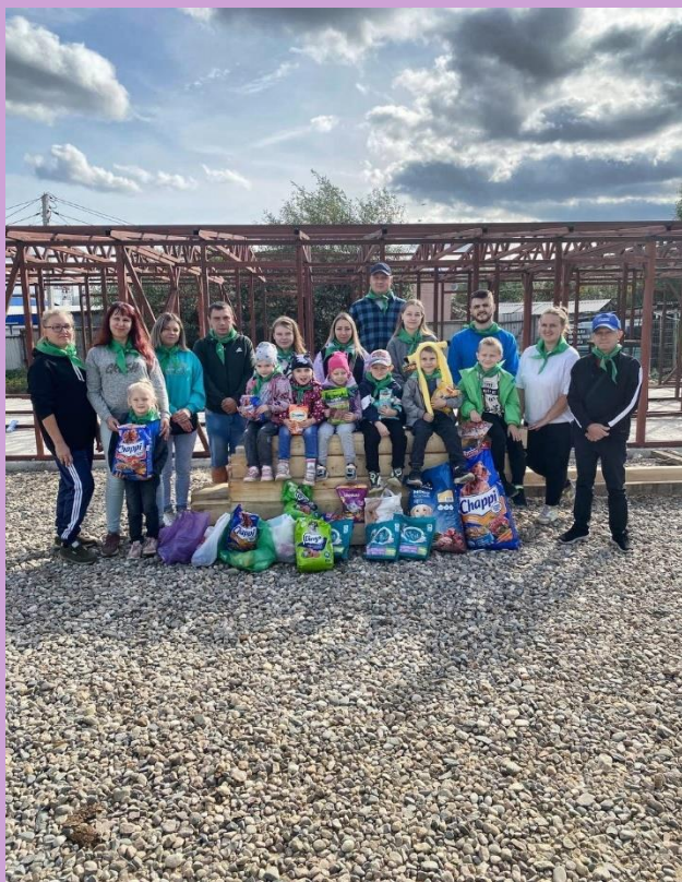
«Мама - зооволонтер»