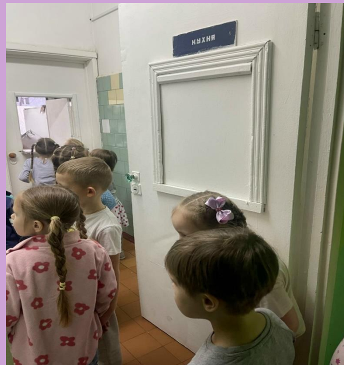
Наблюдение за работой повара