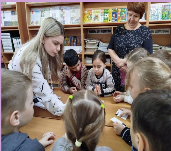
Экскурсия в библиотеку