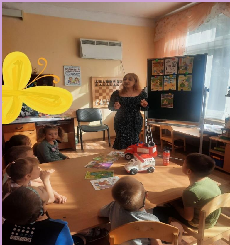
Беседа «Профессия пожарный»