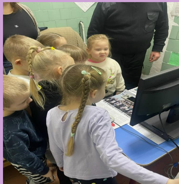
Наблюдение за работой охранника