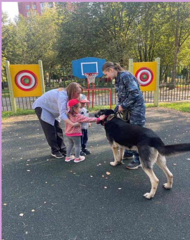
« Мама - кинолог»