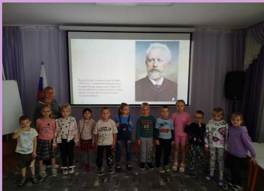
Беседа «Музыкальные профессии»