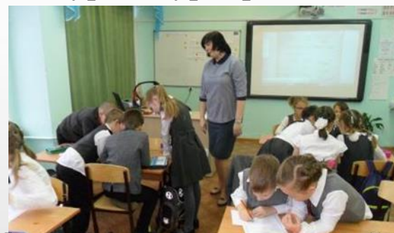
Уроки, на которых у детей могут формироваться компетенции 4К

«Создание творческой личностно-развивающей среды в условиях «ТЕХНО-школы» как ресурс повышения личностного потенциала участников образовательных отношений МОУ лицей №1»