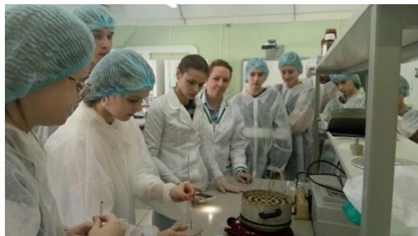
Курсы внеурочной деятельности