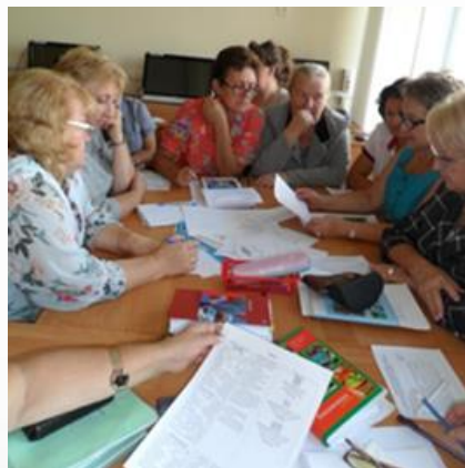
Профессиональное сообщество и партнёры