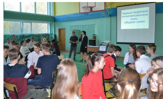
Конкурсы, турниры, выставки, ...