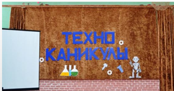
Профильные смены в каникулярное время