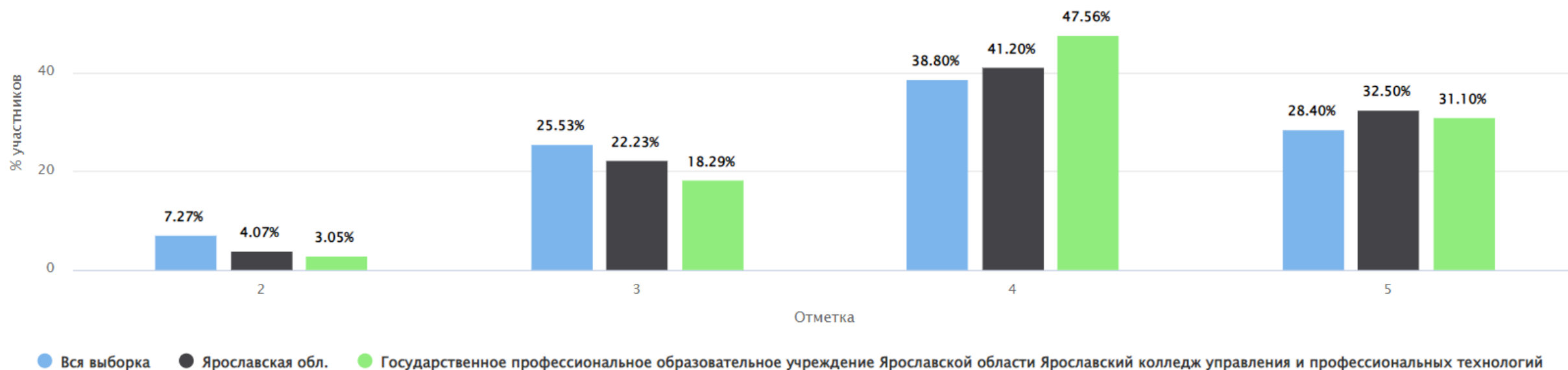
Распределение групп баллов(%)