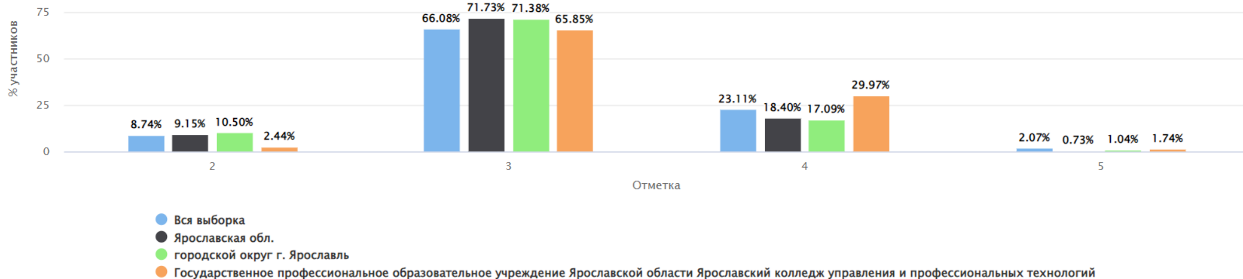
Распределение групп баллов(%)