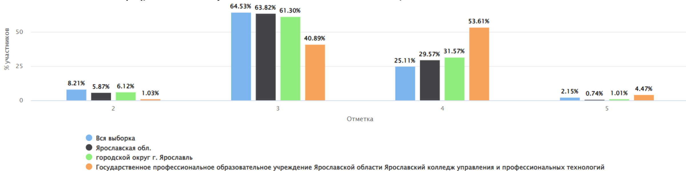
Распределение групп баллов(%)