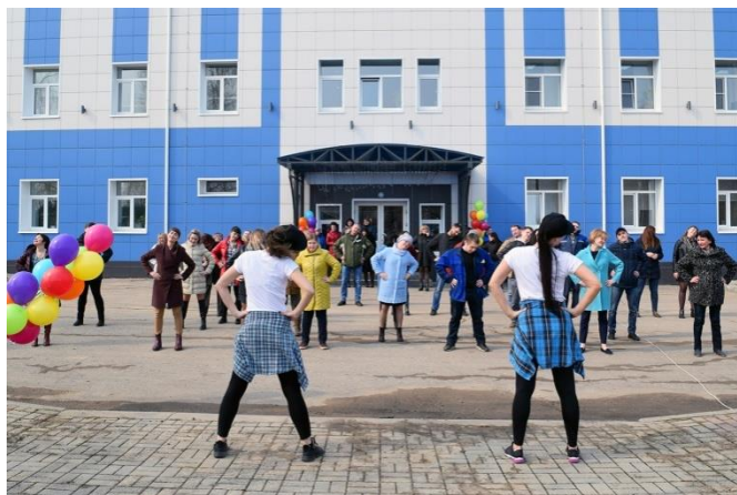
Участие студентов колледжа в общезаводской зарядке, в рамках Дня здоровья на Вымпеле 2020г