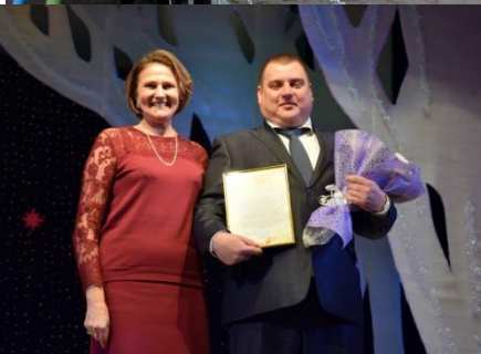
Дни предприятия 2020г