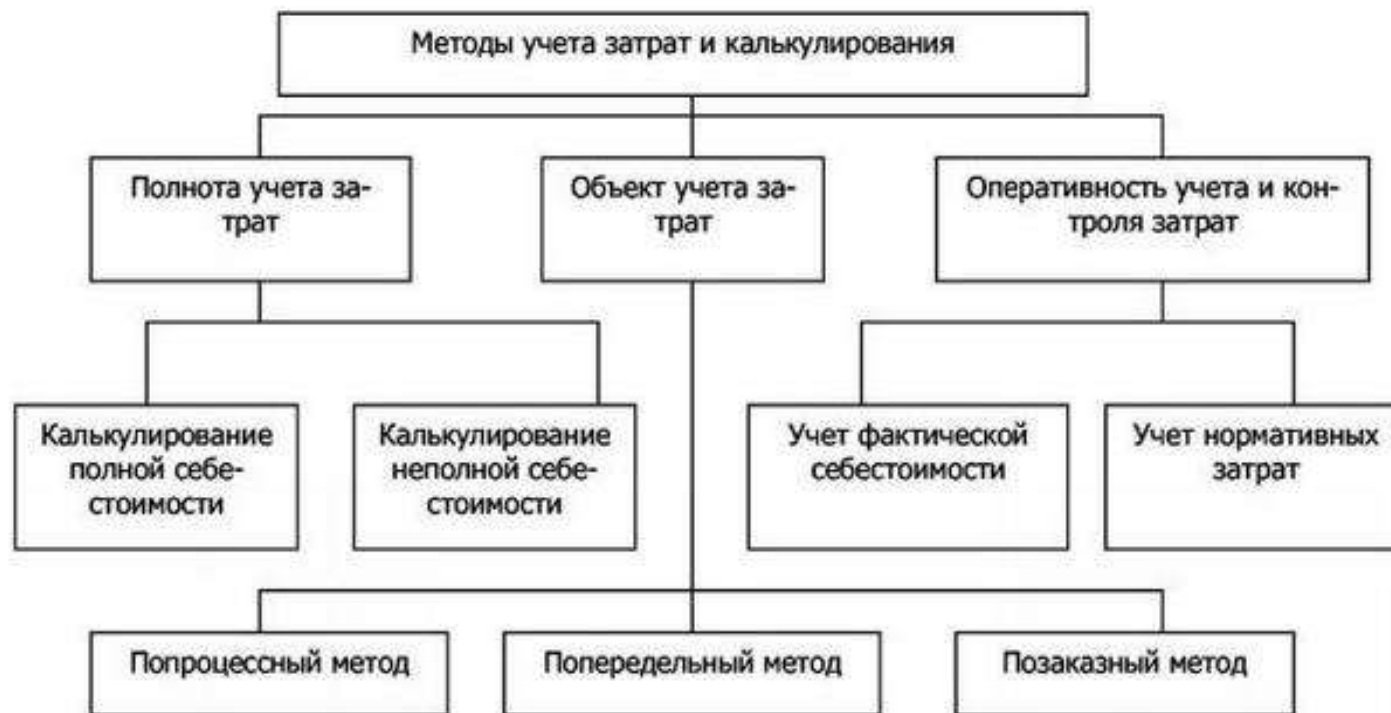
Рисунок. Классификация методов учета и калькулирования затрат

На практике используются различные подходы. Применение того или иного определяют особенности производственного процесса, характер выпускаемых изделий, оказываемые услуги и другие факторы.