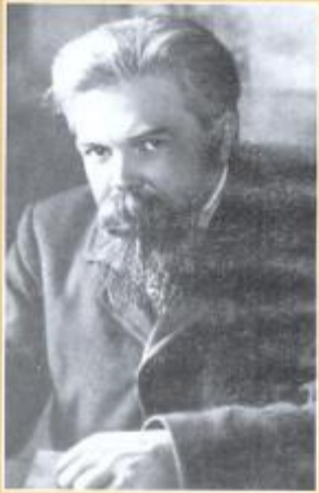
РУБАКИН Николай Александрович